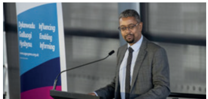
Gweinidog yr Economi, Vaughan Gething AS yn siarad yn ystod y digwyddiad

I ddarllen yr adroddiad ewch i: www.agecymru.org.uk/latestnews